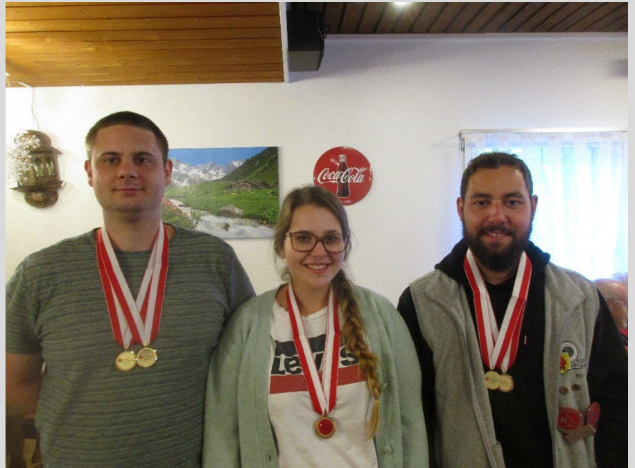
300m Gold für das Team Uni Bern