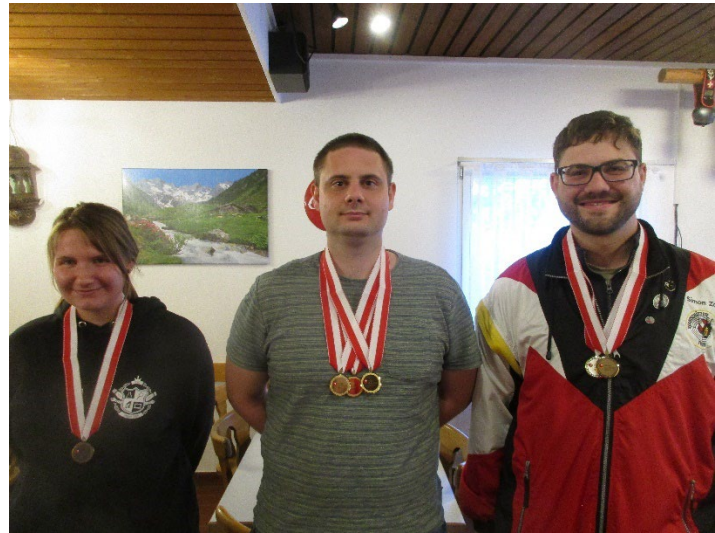
Podest 25m / Einzel