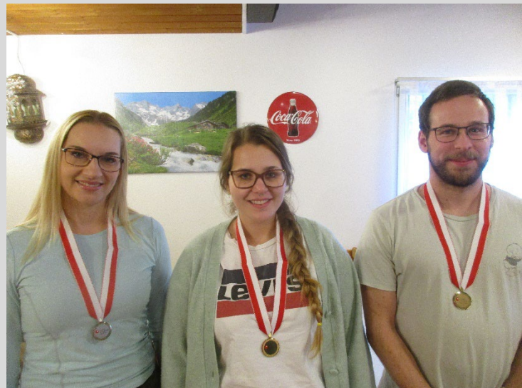
Podest 300m / Kat. A