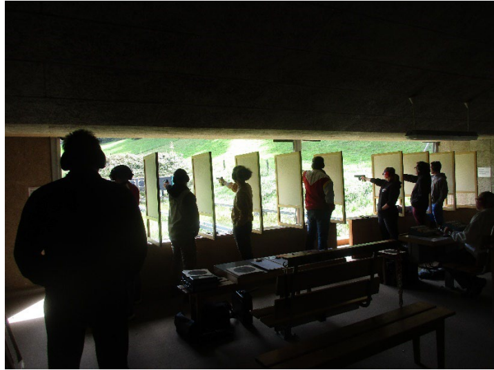
Wettkampfatmosphäre 25m Pistole