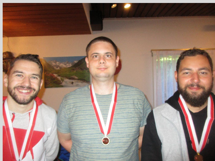
Podest 300m / Kat. D-E