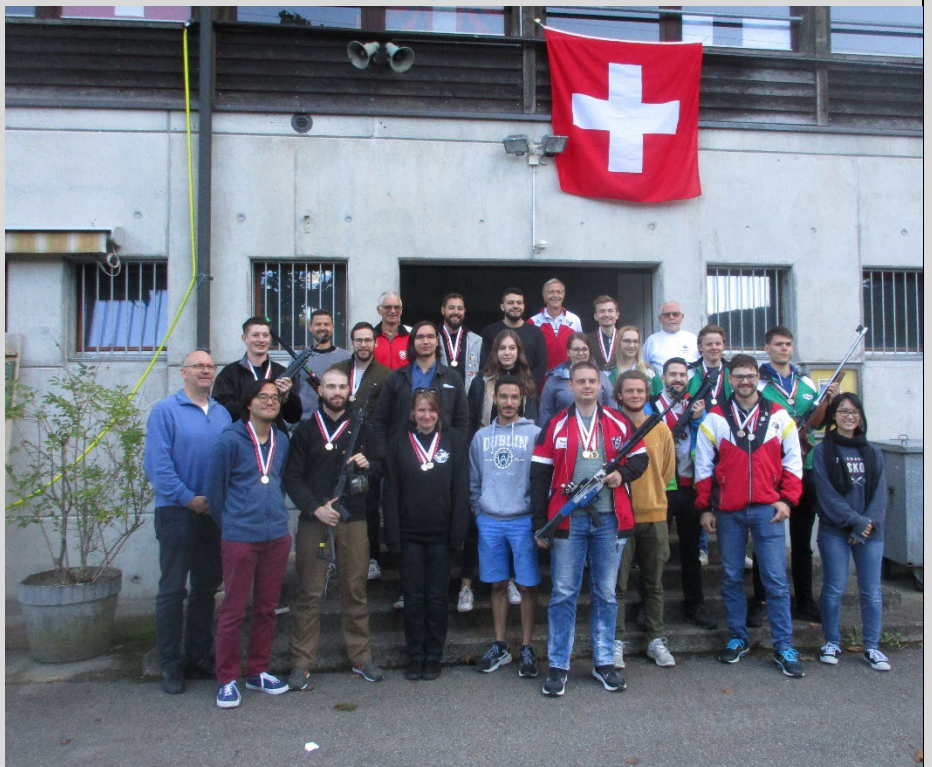
Die studentische 'Schützenfamilie 2022